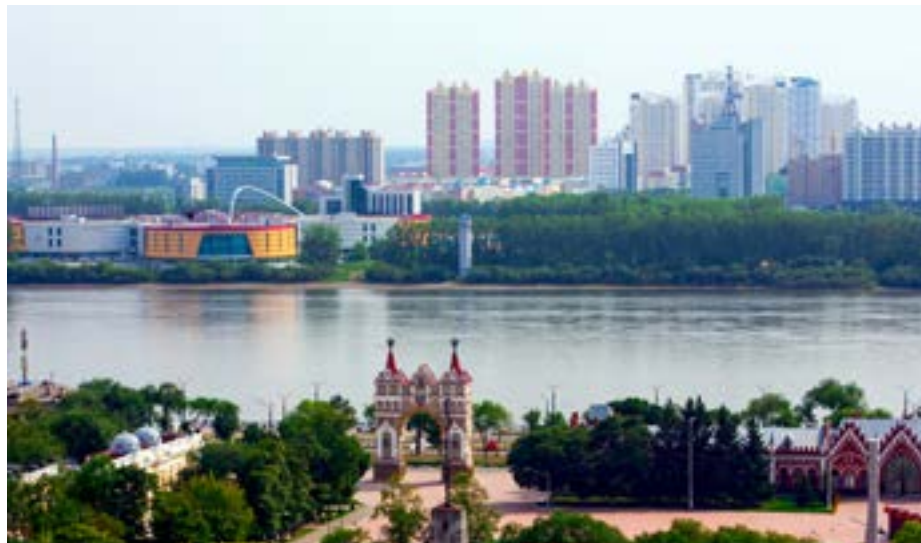
Набережная Благовещенска, где установлена Триумфальная арка, протянулась вдоль Амура на несколько километров

После прогулок по городу можно отправиться сразу... на орбиту Земли. Строительство самой молодой российской космической гавани – космодрома Восточный – еще ведется, но экскурсии уже организуют. Путешественников ждет знакомство с техническим и стартовым комплексами, а также сердцем космодрома – мобильной башней обслуживания. В программу тура входит и посещение музея, где представлены подлинные костюмы и защитные скафандры российских космонавтов. Можно рассмотреть макет космического аппарата «Ломоносов» и элемент двигателя, установленного на первой ракете-носителе «Союз-2.1а», стартовавшей с космодрома Восточный 28 апреля 2016 года. А чтобы стать свидетелем незабываемого события – пуска ракеты – необходимо подгадать свой визит заранее. Обращаться с запросом в туристические компании нужно за 21 день до поездки, чтобы успеть оформить пропуск.