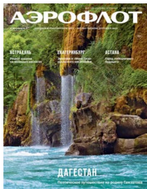
Для авиакомпании ПАО «Аэрофлот – Российские Авиалинии» (порт базирования «Шереметьево», Москва)