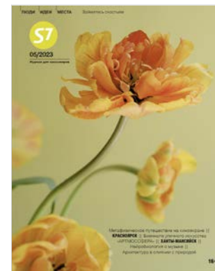
Для авиакомпании S7 (порта базирования «Домодедово» Москва, «Толмачево» Новосибирск)