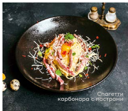
Спагетти карбонара с пастрами